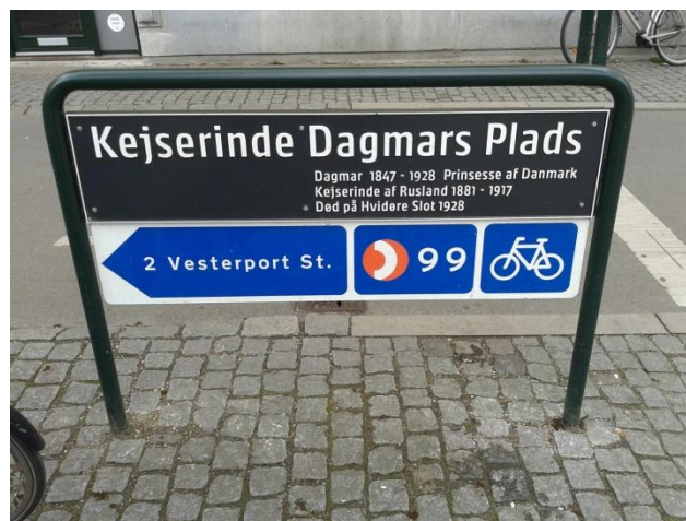
Kejserinde Dagmars Plads, ved Falkoner Alle, Frederiksberg.